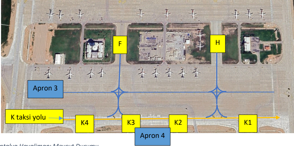
Şekil 1 Antalya Havalimanı Mevcut Durumu

Yukarıdaki Şekil 1’de Antalya Havalimanı Genişleme Projesi kapsamında yapılan F,H,K,K1,K2,K3 ve K4 taksi yolları gösterilmiştir. Özellikle K taksi yoluna taksi yapan trafikler Apron 3 merkez hattına devam etmesi durumunda zaman zaman K taksi yolundan taksi rotası olmamasına rağmen Apron 3 merkez hattına geçebilmektedir. Şekil 1’de görüleceği üzere Apron 3 ile Apron 4’ü birbirine bağlayan araç servis yolları bulunmaktadır. Uçak trafiklerinin K taksi yolunda rotadan ayrılıp direk Apron 3 merkez hattına geçmesi durumunda araç servis yollarında hareketli halindeki araçlarla havacılık emniyetini tehlikeye düşürecek durumların oluşmasına zemin hazırlayacaktır. Bu sebeple K taksi yolundan Apron 3 merkez hattına taksi yapacak uçaklar için 2(iki) tane taksi rotası (K1-K2 arası ve K3-K4 arası) bulunmaktadır.